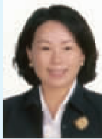
游美雲建議速開放

鳳林車站改善工程牛步化，嚴重影響鄉親的權益，台鐵應該依法要求廠商儘速改善，不能漠視鄉親的權益。