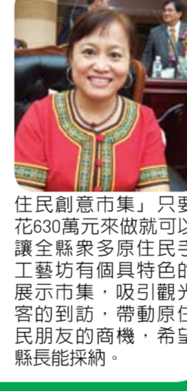
住民創意市集」只要花630萬元來做就可以讓全縣原住民手工藝坊有各具特色的展示市集，吸引觀光客的到訪，帶動原住民朋友的商機，希望縣長能採納。

根據本席了解，花蓮的原住民朋友以超過8成的支持度讓傅縣長高票當選，期盼傅縣長能更努力推動原住民事務，原住民朋友不僅要有幸福感及未來感，也要有經濟感，傅縣長刻正大力推動的印象太魯閣，依縣府所提供的資料，印象太魯閣的規劃案已於4月16日送交通部觀光局審議，預計五月底就可以知道審核結果，最高可獲得3億元的補助款，如順利獲得中央的3億補助款，縣府部分需支出1,500萬元，BOT招商部分廠商需投入6億5千萬，共計10億元，印象太魯閣預計民國101年可以完成，創造原住民500個以上工作機會，但如果一切順利的話，距離印象太魯閣完成也還要2年，縣府應提出更多照顧原住民的政策及方案，像我之前提出的打造「知卡宣森林公園原