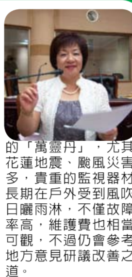
的「萬靈丹」，尤其花蓮地震、颱風災害多，貴重的監視器材長期在戶外受到風吹日曬雨淋，不僅故障率高，維護費也相當可觀，不過仍會參考地方意見研議改善之道。

本席針對蘇花替完工後的交通配套，重點區域裝設路口監視器等議題提出質詢，希望縣府加以重視，加速推動執行。 根據本席了解，中央一再宣示，只要環評通過，蘇花山線改善工程，最快今年底，明年年初即將動工興建，花蓮鄉親多年引頸期盼一條安全回家的路一旦完工，大批外地車輛湧入，勢必造成市區交通壅塞，為避免崇德到花蓮市的交通及市區停車問題，縣府應及早規劃配套方案，積極向中央爭取經費加以改善。 本席了解花蓮地區之前發生重大竊案，警方卻遲遲無法偵破，本人認為少了路口監視器紀錄可疑人車畫面，才會錯失破案重要線索；警察局長周威廷倒認為監視器並非改善治安