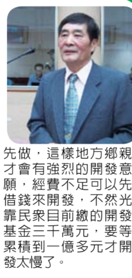
國小召開公聽會，聽取當地民衆的想法，據我所知別的縣市在進行地方開發案時，都是由縣府主導，先有道路才有房子，但在花蓮卻是先有房子，才設置道路，這部分縣府城鄉發展處要多加檢討，不然再怎麼與地方溝通，都無法順利開發，我建議縣府應先把十五米以上的道路先開發，電信、電力、寬頻等基礎建設先行地下化，公共設施要

關於吉安鄉北昌輕工業區的開發案，根據本席了解縣府城鄉發展處應該要主動規劃都市的發展，吉安鄉北昌輕工業區開發案最近吵得沸沸揚揚，當地已禁限建十多年，區內都市計畫獎勵容积率辦法時效也已過了，那區塊是大花蓮地區唯一可以整體開發的地區，佔地七十多公頃，又鄰近花蓮、感謝傅縣長陣子帶領縣府團隊前往北昌