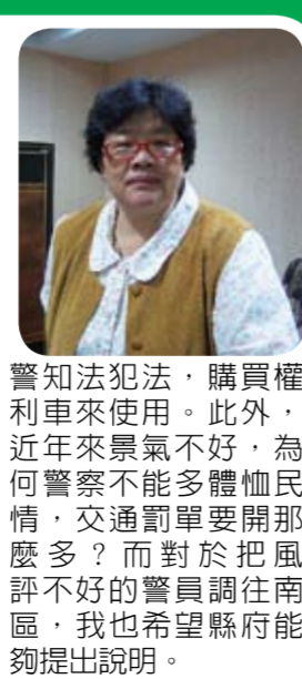
警知法犯法，購買權利車來使用。此外，近年來景氣不好，為何警察不能多體恤民情，交通罰單要開那麼多？而對於把風評不好的警員調往南區，我也希望縣府能夠提出說明。

本席向縣長提出瑞穗溫泉區總面積為960.3公頃，其中規劃單位明定必須擁有三公頃以上土地才能申請開發，且開發土地前要先繳交回饋金百分之四十，導致可能發生還沒開發前就有農民去賣田的怪異情況。且縣長所辦的親民時間，很明顯是架空所有民意代表及各鄉鎮首長的職責，縣長應是縣政的掌舵者，而非是修理路燈的技師。還有，希望縣府的政策要有延續性，如鯉魚潭水舞去年花費1500萬元作固定設施，但自傅縣長上任後，水舞被停辦了相當令人遺憾。 根據本席了解，有民衆發現有權利車（權利車是指車子本身欠銀行貸款，車主繳不起貸款將汽車當給當舖，又因為他們還是無錢贖回，最後使車子成為流當品。）停在縣警局停車場，他質疑是否有員