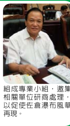
組成專業小組，邀集相關單位研商處理，以促使佐倉瀑布風華再現。

根據本席了解，佐倉瀑布位於空軍佳山基地後方山麓，距離花蓮市中心約七公里，風景優美，水源豐沛，是花蓮縣目前最大的瀑布景點，三十年前是花蓮地區民衆夏日最喜愛前往戲水的風景名勝。後因空軍佳山基地的設置，軍事設施及高圍欄阻斷了通往佐倉瀑布的道路，致該景點荒廢，逐漸被民衆所遺忘。 我認為佐倉瀑布絕對是花蓮縣最美麗、最珍貴的自然景點，理應適當開發與建設，提供民衆及遊客觀賞遊樂，但是該景點的開發涉及軍方用地及林務用地的取得以及對外通路用地、私有土地徵收暨建設經費的編列，有必要