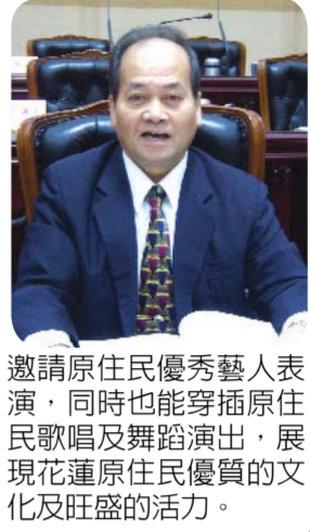
邀請原住民優秀藝人表演，同時也能穿插原住民歌唱及舞蹈演出，展現花蓮原住民優質的文化及旺盛的活力。

本席非常肯定傅縣長上任以來帶領縣府團隊積極投入各項縣政建設，落實服務便民政策，成效有目共睹，根據最近的媒體民調顯示花蓮鄉親幸福感受居全國第一名，縣府施政滿意度治安、就業等七個項目中有四個項目獲得全國第一名，上任半年就有如此優秀的政績，若連續執政8年花蓮一定會更好。 今年初縣府舉辦的2010太平洋國際觀光節活動，傅縣長每天親自到現場與民衆們一起觀賞表演，就算是下雨天傅縣長也與民衆們一起穿雨衣看表演絲毫不受大雨的影響，讓表演者感受到花蓮的熱情，孫永昌表示原住民傳統文化是花蓮重要的文化資產，建議縣府下次再辦類似活動時，能