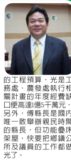
的工程預算，光是工務處、農發處執行相關計畫的年度經費缺口便高達1億5千萬，另外，傅縣長是國內唯一敢舉辦親民時間的縣長，但功能疊床架屋，快要把鄉鎮公所及議員的工作都做光了。

本席認為傅縣長上任以來，便確立「觀光大縣 幸福花蓮」為施政主軸，今年初籌劃全台的十八天十八夜「太平洋國際觀光節」成果顯著，但他認為活動移師玉里加碼三天三夜晚會仍不夠，將來希望十三鄉鎮市都能輪流舉辦，尤其最近縣府積極推動兩岸觀光包機直航，希望縣府協助陸客帶往南區各鄉鎮，讓南區觀光業者也能同享觀光發展的具體成果。 本席也重視玉里鎮赤柯山的解編進度，我強調解編後將可讓農民合法承租，每年赤柯山、六十石山金針花季，剛好是原住民豐年祭活動期間，我建議將媲美瑞士景觀的金針山資源，結合南區豐沛溫泉資源，有關農路修整，請農業發展處務必多費心，還有縣親時間，有許多民衆建議農路及排水溝工程，所需高達1億9千萬