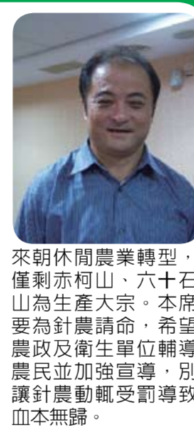
來朝休閒農業轉型，僅剩赤柯山、六十石山為生產大宗。本席要為針農請命，希望農政及衛生單位輔導農民並加強宣導，別讓針農飽受罰鍰致血本無歸。

根據本席了解，市售金針乾製品二氧化硫殘留量超出食品衛生標準，近三年累積違規件數高達291件，讓多位花蓮南區針農因而遭到處分，我建議衛生及農政單位加強宣導，教導消費者金針應先「泡」水食用，檢驗方式也應改變，畢竟金針乾不像蜜餞可直接吃下肚，衛生單位應參酌實際狀況並加強輔導，保證農民生計及消費權益，創造雙贏局面。 根據本席了解，近來外縣市抽檢金針檢驗不符規定移轉本縣衛生局辦理，從96年至99年，違規件數計291件，案件眾多，其中241件被依違反食品衛生管理法處罰鍰94萬元。 本席了解位於花蓮南區的玉里鎮赤柯山、富里鄉六十石山與台東縣太麻里為國內金針三大主要產地，隨著太麻里近年