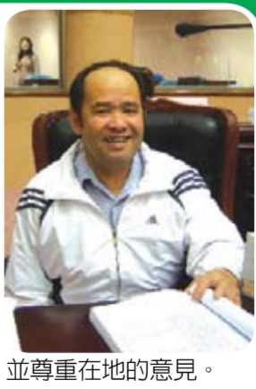
並尊重在地的意見。

本席非常肯定縣長傅現其上任以來的種種政績外，並針對瑞穗紅葉溫泉特定區的開發案及山坡地造林政策補助不公等議題提出質詢，傅縣長強調「維持原有風貌是縣府最重要的堅持」，縣府絕對有信心將瑞穗紅葉溫泉區打造為國際級的溫泉度假勝地。 本席雖然樂見縣府推動瑞穗紅葉溫泉特定區為當地民衆帶來生活條件的改善，同時也憂心開發後會如同南投廬山、臺北烏來等地一般，原住土地被財團所佔，獲利的不是原住民而是財團，希望縣府能夠多關懷原住民