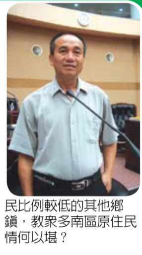
民比較低的其他鄉鎮，教家多南區原住民情何以堪？

本席要對原住地區公共建設等議題提出看法，我認為公共工程不應有南北差異，質疑投入在南區的建設經費與北區有很大差別，縣長傅現其舉實數據，指今年原民會核定四項工作計畫經費，南區鄉鎮所佔比例約四分之一強，與當地原住人口所佔比例相當，他也重視原住民保留地增編編進度與手工藝品展售等相關議題，指示原住行政處協助推廣並朝精緻化、提生產值目標邁進。 本席第一次質詢，首先要替任在南區原住民鄉親抱屈，我認為南區原住民部落需要施做的產業道路公共工程非常多，相關經費都是中央原民會補助，希望能再增加一點，我質疑原民會許多工程經費不是擺在原住民地區而是原住