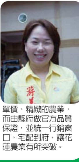
是國際農業發展的重要趨勢，能改善高級農藥肥料的效用及品質，希望縣府應積極爭取。

本席非常肯定縣長傅現其執政近五個月來政績卓著外，也期盼傅縣長能全力推展國際觀光，今年初盛大辦理的18天18夜太平洋國際觀光節活動後，在印象太魯閣未完成之前，也能加強發展文化創意產業。另外，我也期盼縣府能透過落實各項農業政策加強照顧花蓮廣大農民，尤其生物農業