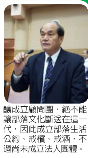
釀成立顧問團，絕不能讓部落文化斷送在這一代，因此成立部落生活公約、戒檳、戒酒，不過尚未成立法人團體。

本席請問縣長傅現其一個問題，針對「何謂村莊？何謂部落？」兩者區別為何？本席認為這是漢人社會長期對原住民存在歧視，早期各部部落叫「番社」，象徵蠻荒落後，如今原住民待遇雖獲大幅改善，但要達到真正自治仍有極大差距。 根據本席了解，目前縣府推動兩岸觀光直航包機，每天有高達五、六千名大陸客到花蓮遊覽消費，利益僅是少數財團，原住民卻只能乾瞪眼，希望縣府可以拿出具體辦法，協助原住民爭取陸客團帶來的商機，改善經濟生活。 原住民樂天知命，平日在原鄉多半以狩獵、撿狗牛、採野菜、管理自己的事務，在產業基礎非常薄弱情況下，需要縣府伸出援手，最近我跟族中耆老探討，釀